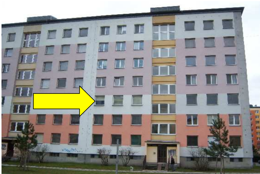
Pohled severovýchodní na dům č. p. 1226