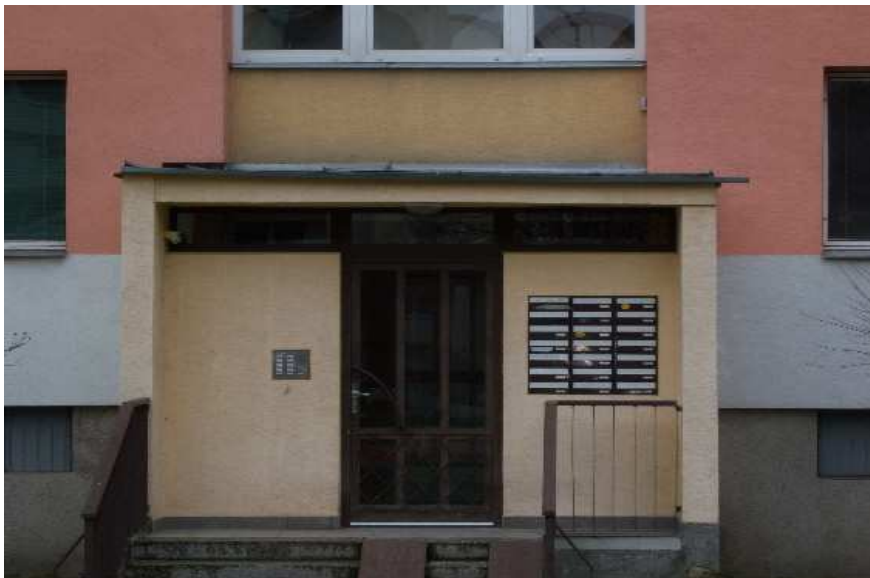
Hlavní vstup do domu č. p. 1226