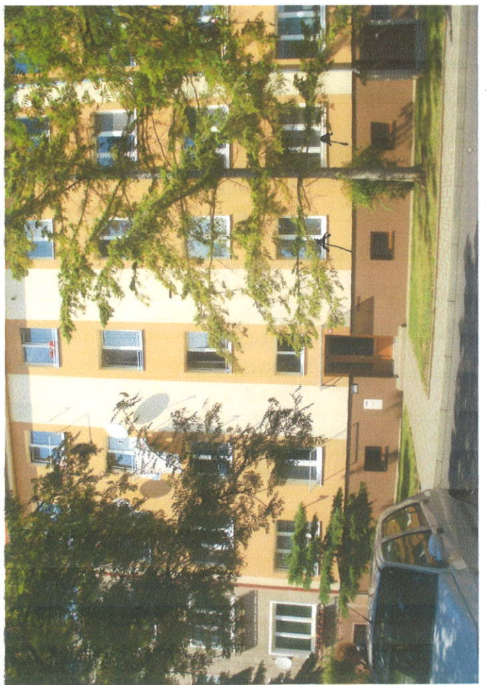
↑ okna klychi ↑ 4-yez Airov