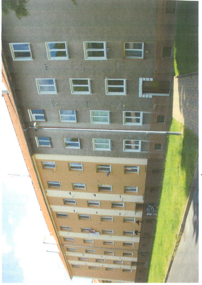
↑ Izadim' fradlet