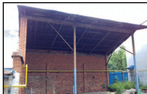
Přístřešek u skladu hutního materiálu