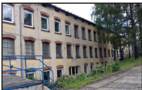
Objekt dílen a skladů