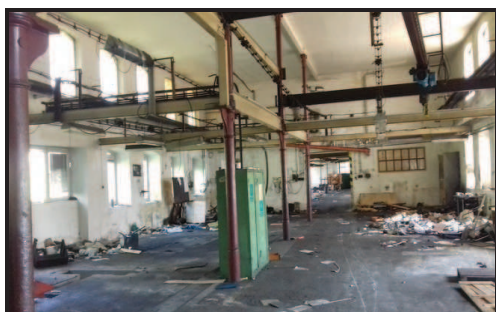
Výrobní prostory ve II.NP