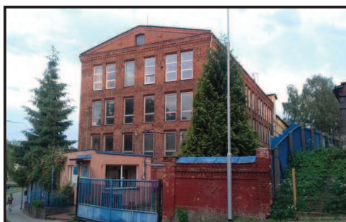
Hlavní vjezd do areálu