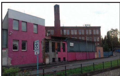
Celkový pohled z ulice Dolní brána