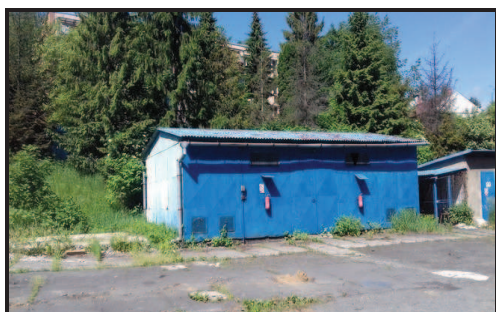
Plechový sklad u montážní haly