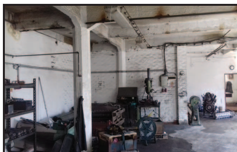
Výrobní prostory v I.NP