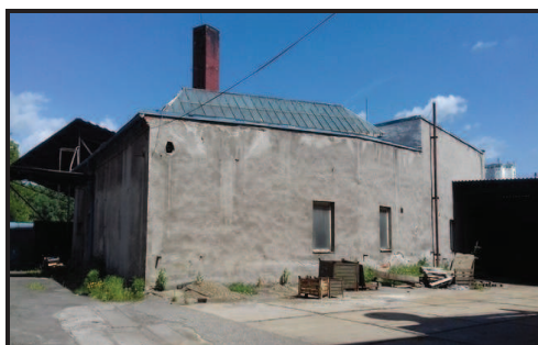
Objekt sociálního zázemí s kotelnou