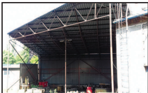
Přístřešek u kotelny