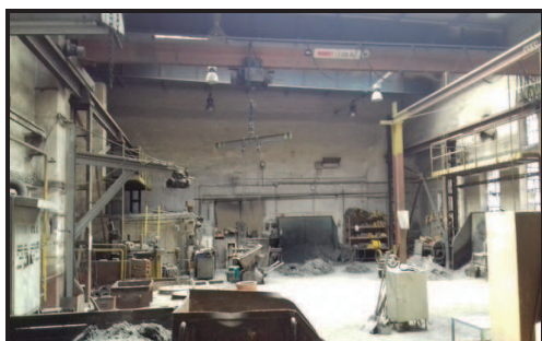
Výrobní prostory ve slévárně