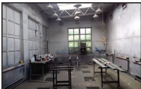
Lakovna v montážní hale