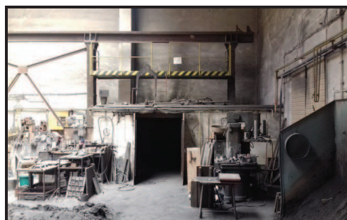
Výrobní prostory ve slévárně