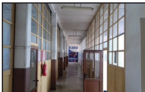
Administrativní prostory ve IV.NP