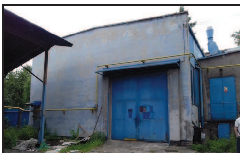
Sklad hutního materiálu