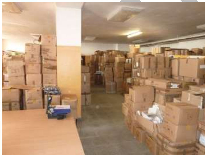
Obr. 3 Uložení zboží