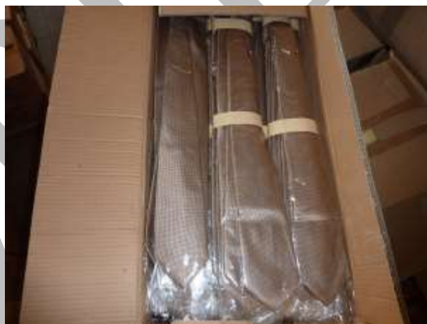
Obr. 28 Kravaty