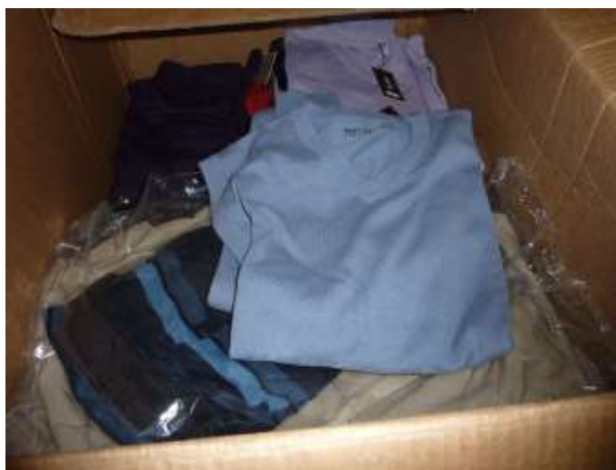
Obr. 14 Svetříky