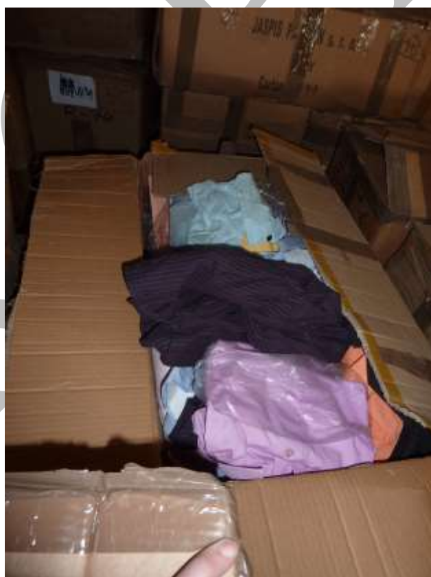
Obr. 9 Částečně zabalené halenky