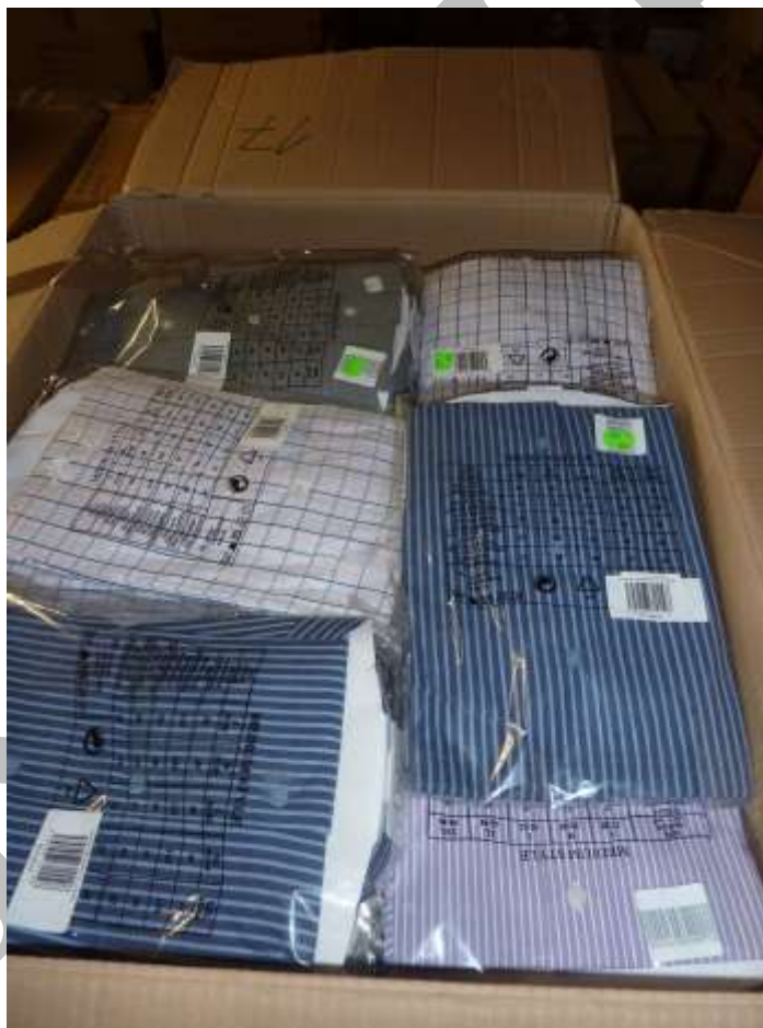
Obr. 13 Košile Lugi Botoni