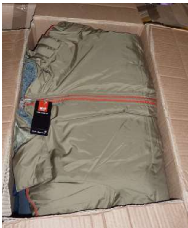
Obr. 8 Bundy White Mountains