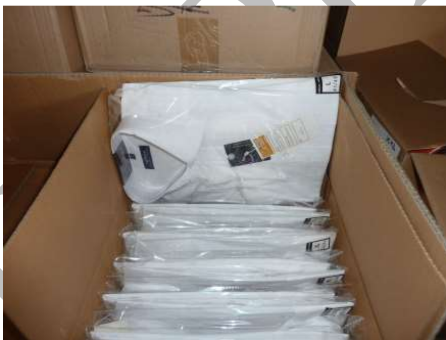
Obr. 21 Košile Reflex v uceleném velikostním sortimentu