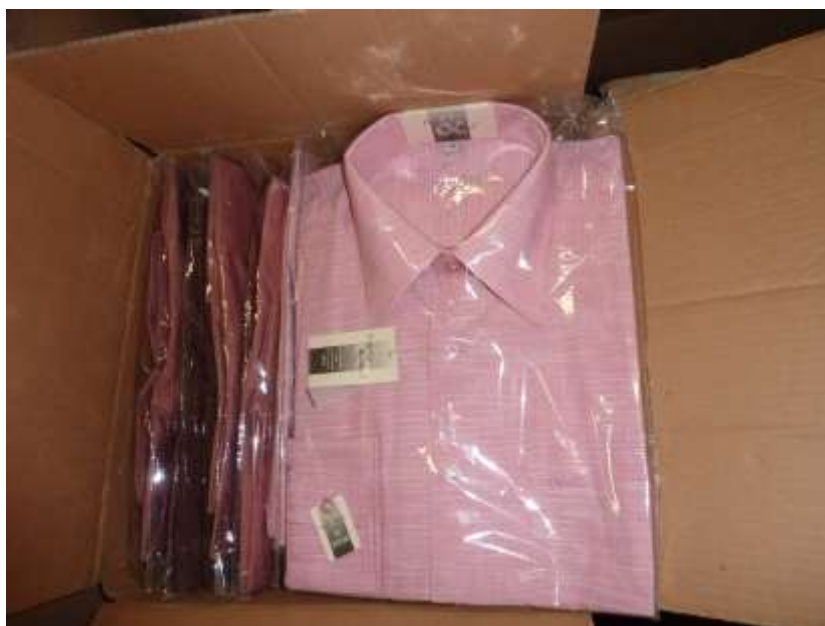
Obr. 17 Košile FR