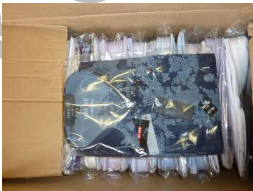
Obr. 29 Košile Native