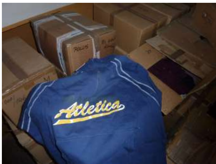
Obr. 12 Tepláky