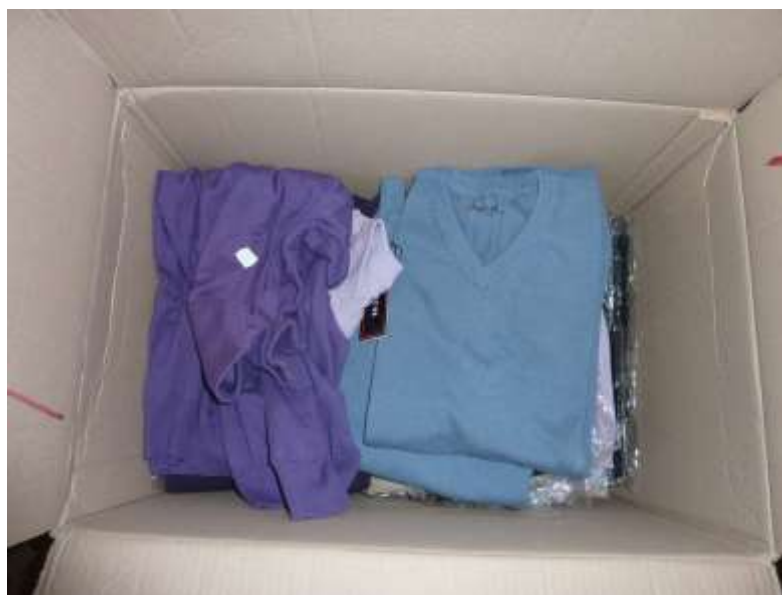
Obr. 27 Lehké svetry