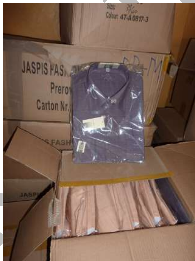
Obr. 26 Košile FR