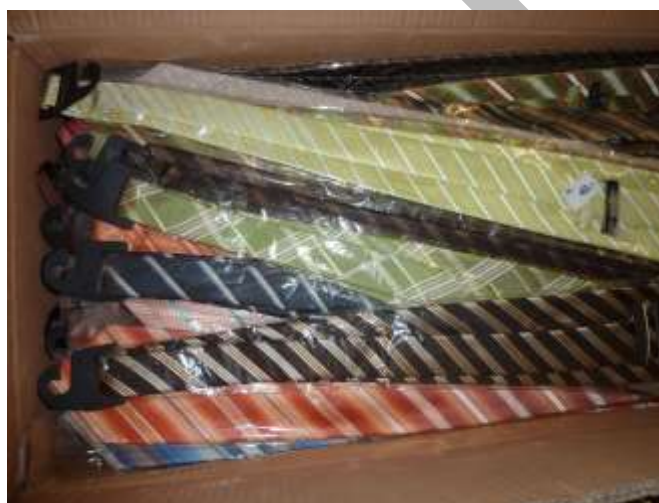
Obr. 6 Kravaty