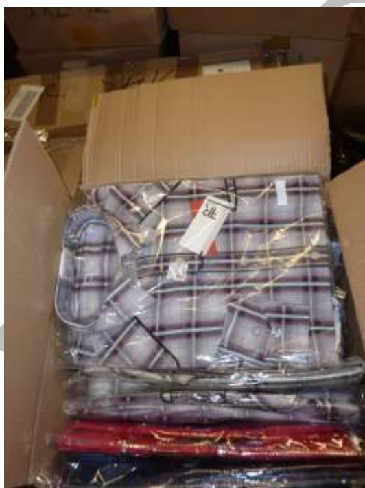
Obr. 18 Košile FR