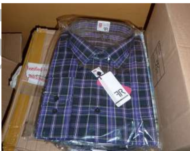
Obr. 7 Košile Friends and Rebels (FR)