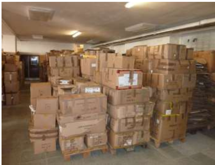
Obr. 2 Uložení zboží