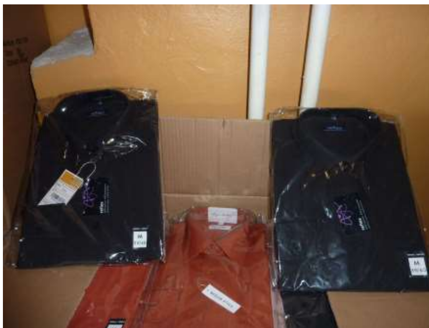
Obr. 20 Košile Reflex