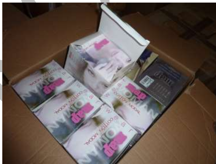
Obr. 11 Spodní prádlo - Tanga