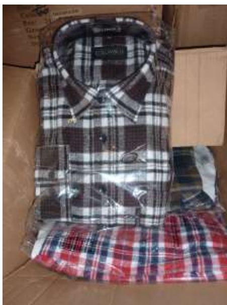
Obr. 5 Flanelové košile Columbus