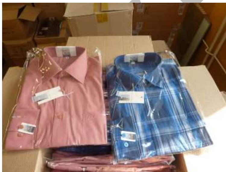
Obr. 23 Košile FR