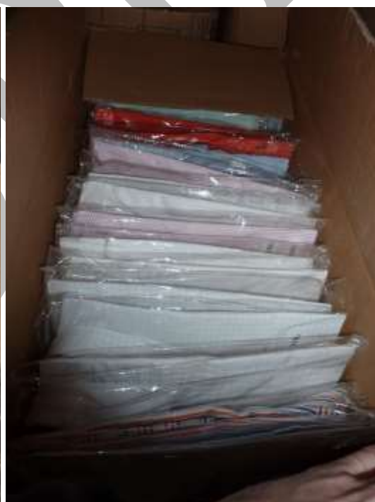
Obr. 19 Košile FR