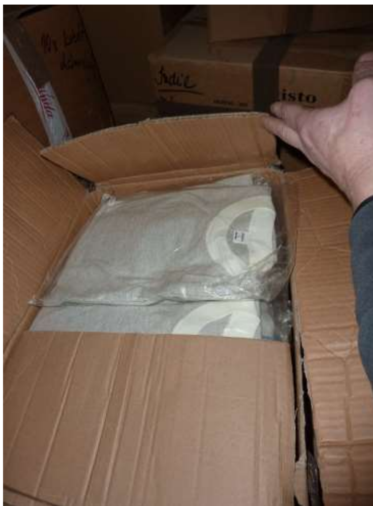
Obr. 10 Trika Air fashion