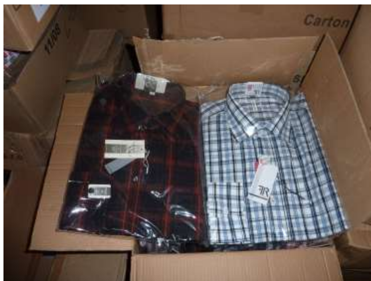
Obr. 25 Košile FR