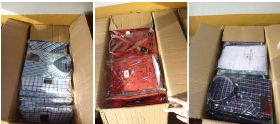
Obr. 22 Kolekce košilí Native