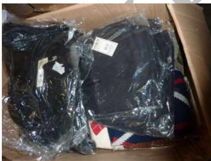
Obr. 15 Svetry Kensington east side