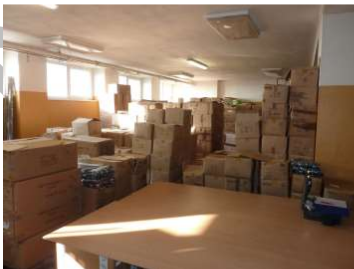
Obr. 4 Uložení zboží