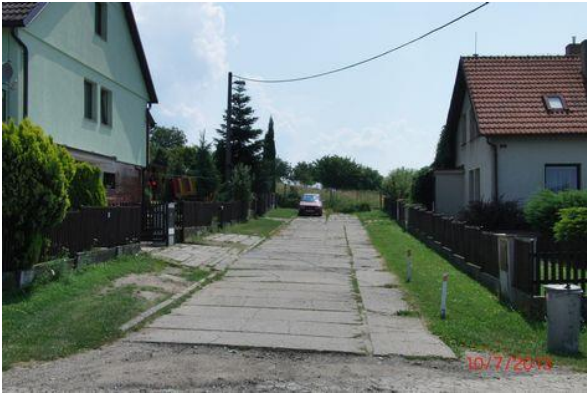
Pohled od přístupové panelové cesty