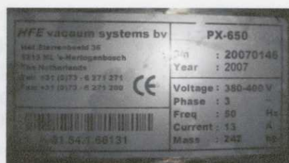
Obr. č. 2. vyr. štítek Balícího stroje PX – 650