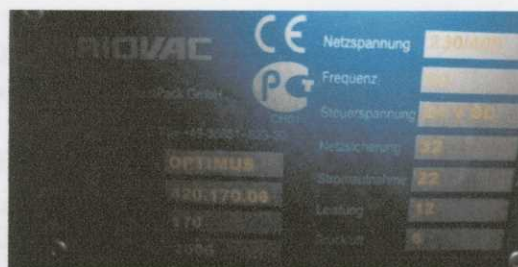
Obr. č. 3. Balící stroj Variovac - Optimus