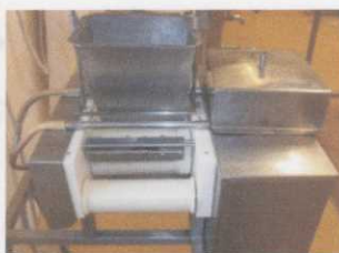
Obr. č. 1. Vytahovací stroj

IM 002-2, Vytahovací stroj, CO je ve výši 24.534,00 Kč