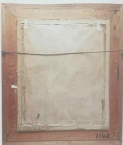
Obr. 2-3. Přední a zadní strana obrazu v rámu.