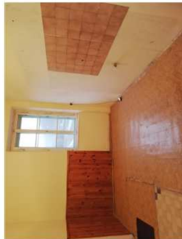
Východní trakt - II.N.P.