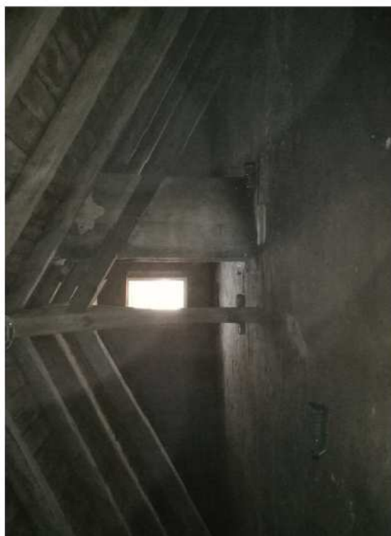
Západní trakt - I.P.P. a podkroví