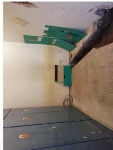
Střední trakt + zázemí restaurace