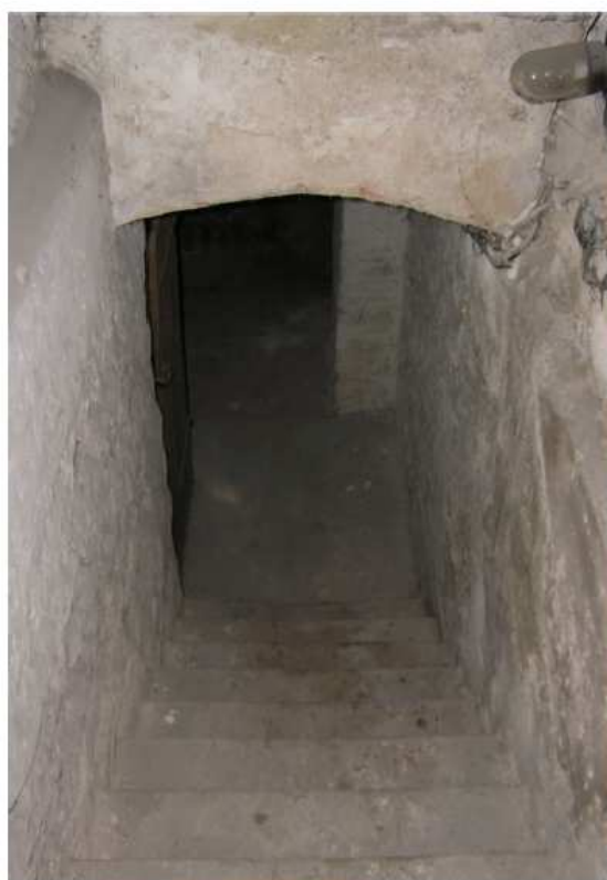
Východní trakt - I.P.P. a podkroví