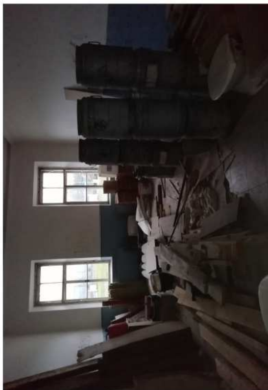
Západní trakt - I.N.P.