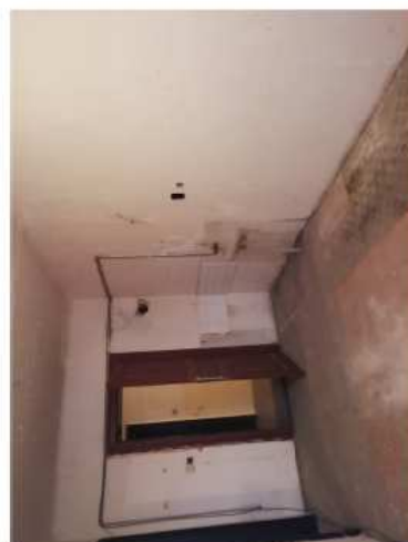
Východní trakt - III.N.P. + podkroví