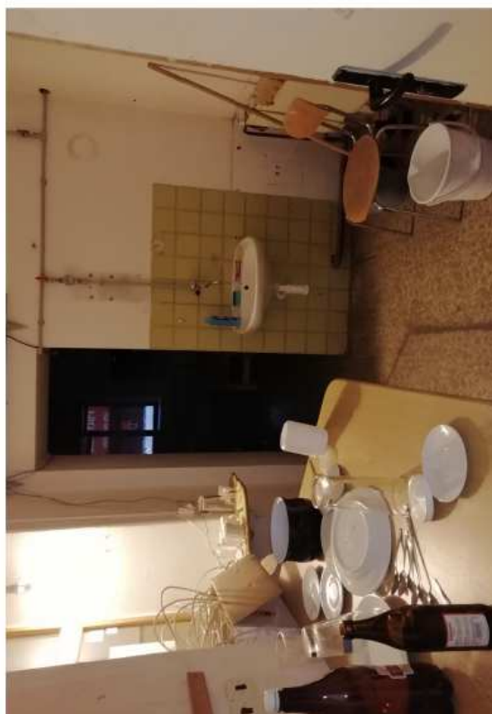
Východní trakt - I.N.P.